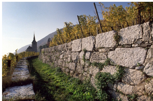
Trockenmauern oberhalb von Ligerz