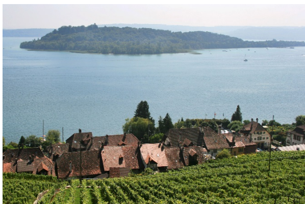
Twann am Ufer des Bielersees und St. Petersinsel