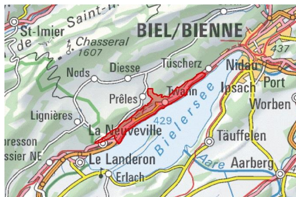
IFP 1001 Linkes Bielerseeufer