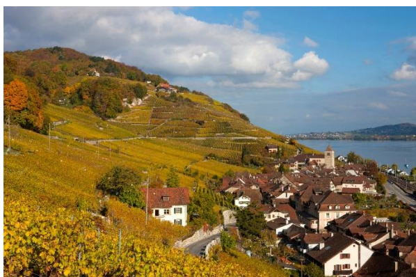
Coteaux viticoles au-dessus de Douanne