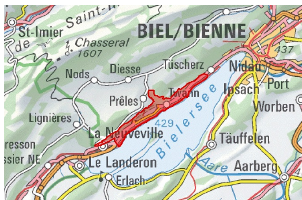
BLN 1001 Linkes Bielerseeufer