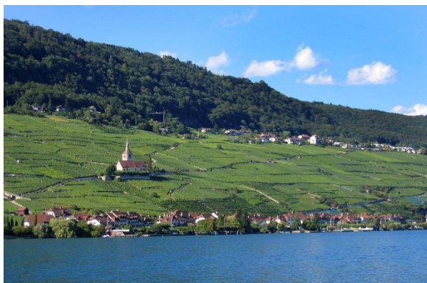
Gléresse avec son église de pèlerinage