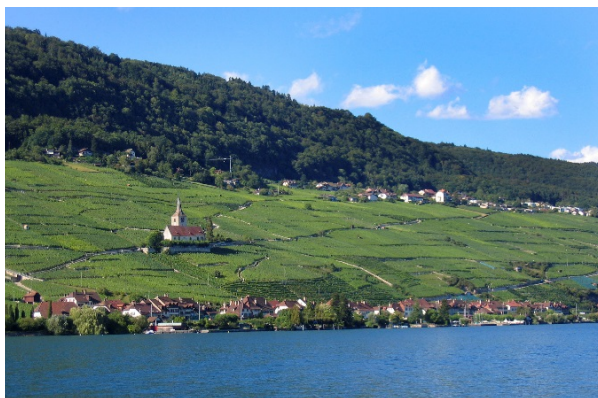
Gemeinde Ligerz mit der Wallfahrtskirche