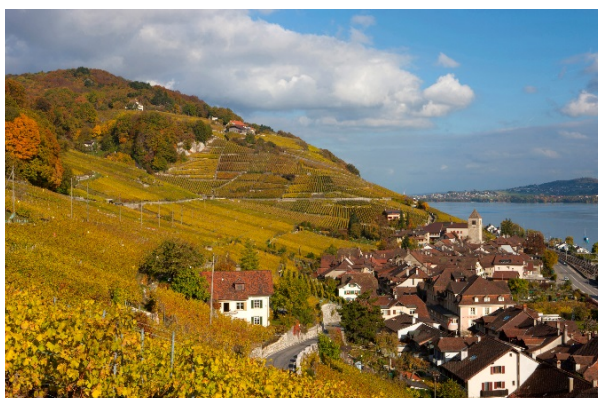
Rebberg oberhalb von Twann