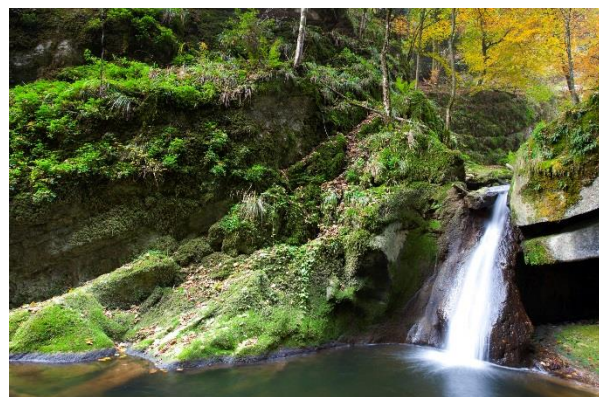
Partie inférieure des gorges de Douanne