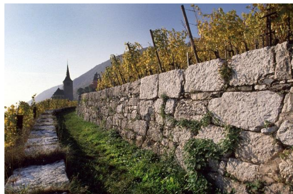
Murs de pierres sèches au-dessus de Gléresse